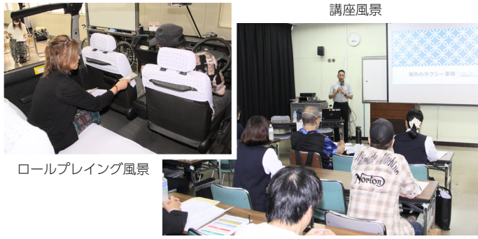
ロールプレイング風景