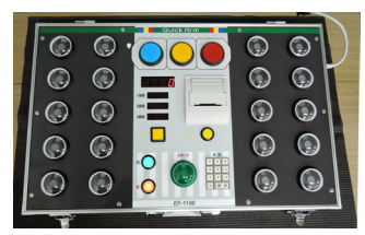
俊敏性検査機 クイックアーム